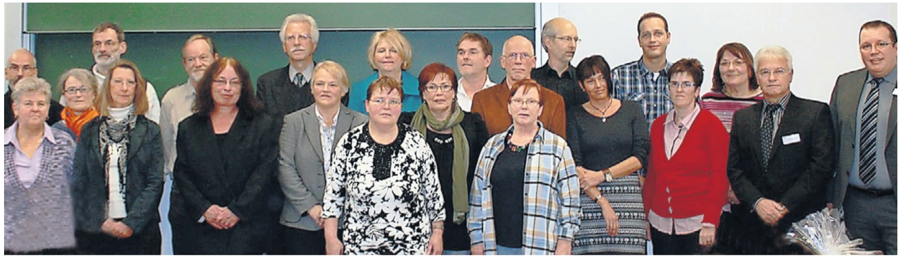
Im Rahmen einer Feierstunde wurde den langjährigen Mitarbeitern Dank für die geleistete Arbeit ausgesprochen. Viele der Angestellten sind nach der Ausbildung bei dem Unternehmen geblieben und arbeiten seit mehr als 40 Jahren bei Vitos Gießen-Marburg.

E-Mail: wirtschaft@op-marburg.de Fax: 0 64 21/409-302